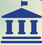
TÍN CHỈ ĐẠI HỌC