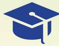
VĂN BẰNG HAI NĂM