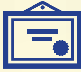
CHỨNG CHỈ CÔNG NGHIỆP